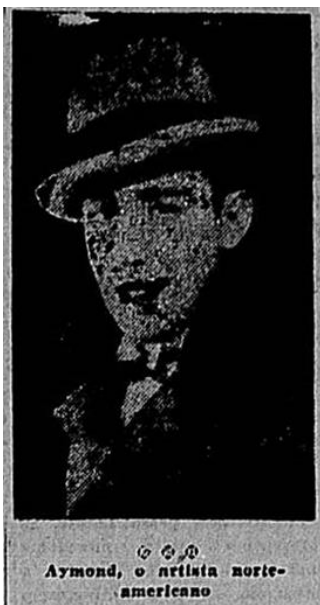
Imagem 1: Fotografia de Aymond anexada a nota de jornal com a legenda “AYMOND, o artista norte-americano”.