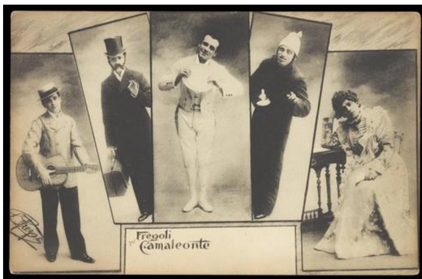
Imagem 3: Leopoldo Fregoli, in drag, poses in several inset portraits. Process print, 1903.