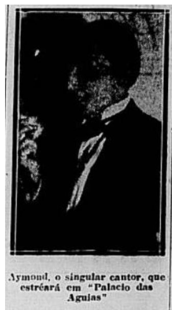
Imagem 5: Recorte de fotografia anexada a reportagem de jornal com a legenda “Aymond, o singular cantor que estréará em “Palácio das Águias” .