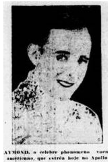
Imagem 2 – Fotografia de Aymond anexada a nota de jornal com a legenda “AYMOND, o celebre fenômeno vocal americano que estreia hoje no Apollo”.

Fonte: nota de 8 de setembro de 1926 do jornal A gazeta. São Paulo. (Disponível em: Disponível em: < http://memoria.bn.br/DocReader/DocReader.aspx?bib=090972_07&pesq=aymond&pagfis=22669 >