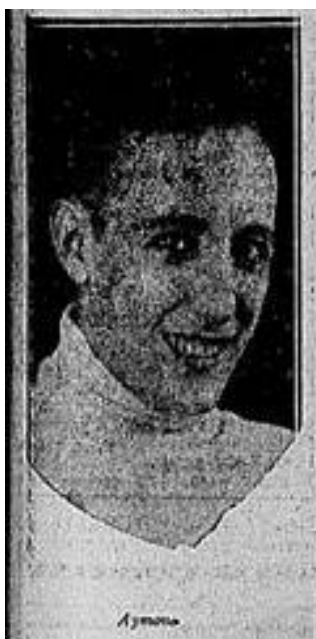
Imagem 4: Recorte de fotografia anexada a reportagem de jornal com a legenda “Aymond” .