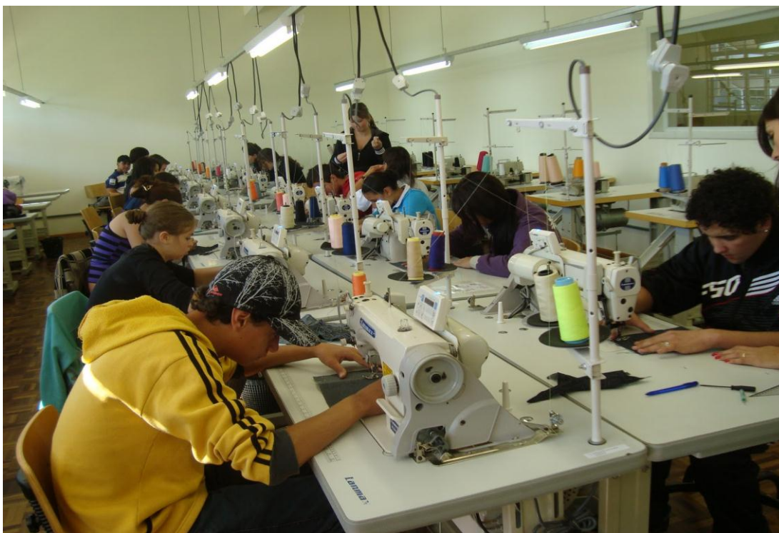
Fotografia 2 – Parceria do CEJA com outras instituições