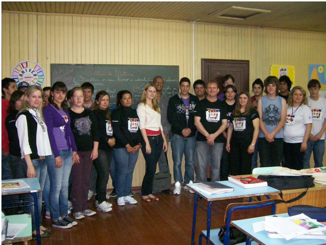
Fotografia 1 – Visita do consultor do MEC no CEJA Erechim.