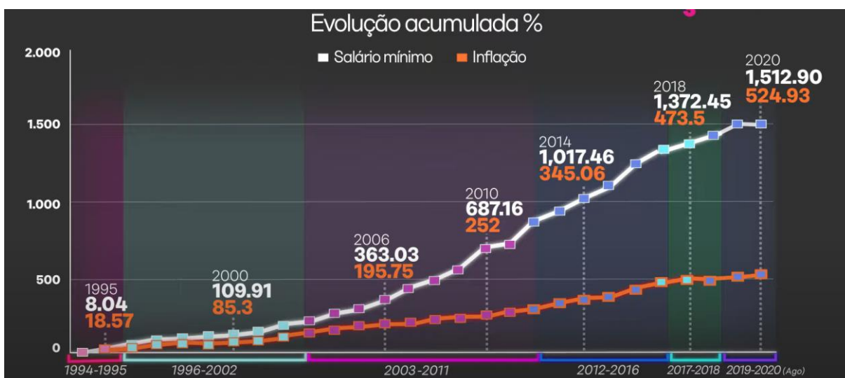
Gráfico 1 - Salário mínimo x inflação

Considerando essas taxas médias, o valor projetado para o salário mínimo em janeiro do ano de 2067, ano em que uma pessoa do sexo masculino atingiria seus 65 anos para se aposentar ficou em R$15.087,50 (5 anos); R$30.510,96 (10 anos) e R$48.718,75 (15 anos). O salário mínimo é adotado aqui como valor referencial, tendo clareza de que o salário mínimo, a inflação e o poder real de compra são problemáticas enfrentadas constantemente pelo brasileiro, além da bolha previdenciária. De acordo com Sobrinho (2020), a inflação tem superado o reajuste anual do salário mínimo, o qual é obrigatório desde 2007. O gráfico 1 expressa a variação da inflação e do salário mínimo a partir de 1994, início do plano real.