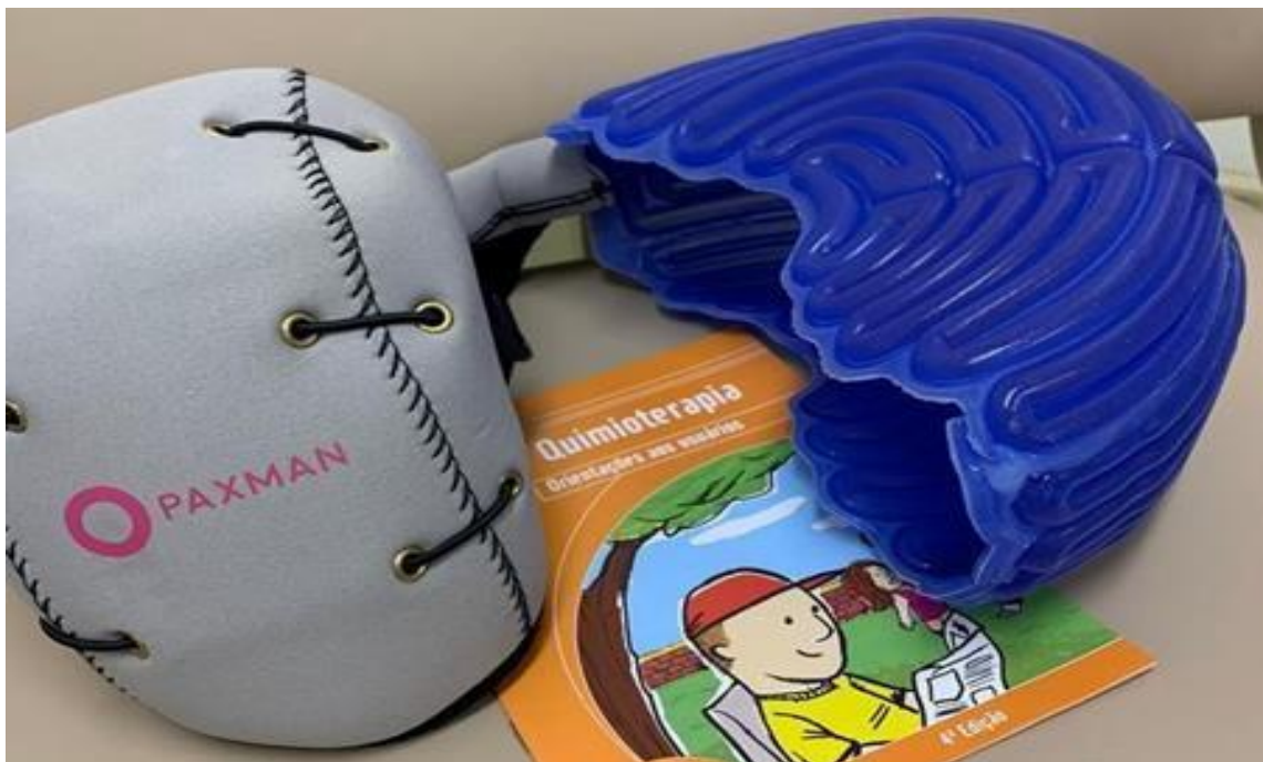
Figura 2: Touca inglesa Paxman

O sistema é composto por uma touca de silicone interligada à máquina, uma faixa de tecido para proteção da região frontal, uma touca secundária para fixar e manter frio circulante. O fabricante indica umedecer o cabelo e aplicar condicionador antes de aplicar a touca de silicone para melhorar a condutividade. Este dispositivo pode ser utilizado por duas pessoas ao mesmo tempo, já que contém dois sistemas interligados na mesma máquina e possui toucas em três tamanhos P, M e G. O sistema Paxman possui certificação do FDA (Food and Drug Administration) e hoje é incluso nas Diretrizes de Práticas Clínicas em Oncologia da NCCN.