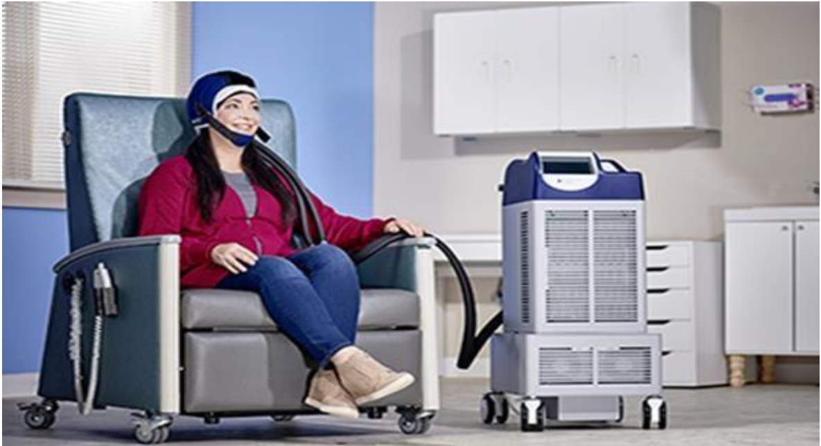
Figura 4: Touca DigniCap