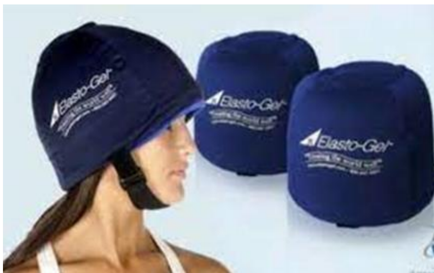
Figura 1: Touca de elastogel.

Esta modalidade de touca não é mais fabricada nos dias atuais, sua aquisição pode ser realizada através de sites de compra e venda na internet, sendo que no site da empresa da elastogel não se encontra mais disponível. Os locais que querem disponibilizar este método para seus pacientes devem conter um freezer para armazenar as toucas já que elas devem manter-se em temperaturas negativas.