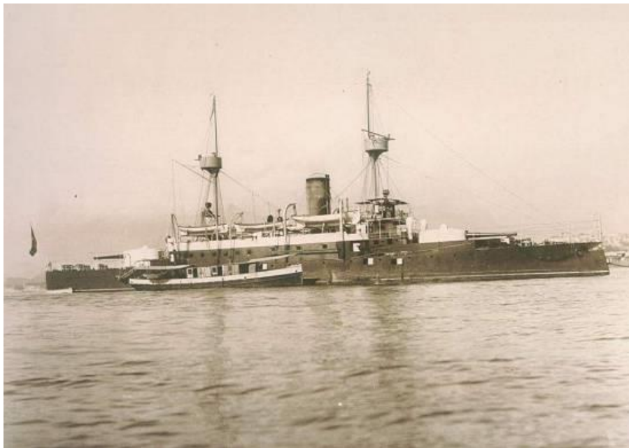
Figura 4 – Contratorpedeiro Deodoro, participante da Revolta da Chibata, início do século XX.