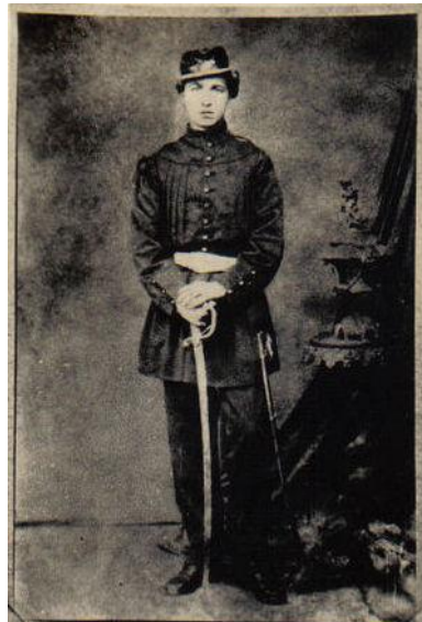
Figura 6 – José Gomes Pinheiro Machado, aos 15 anos, após alistamento no Corpo de Voluntários da Pátria (Guerra do Paraguai), 1865.