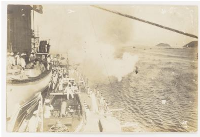
Figura 5 – Navio tomado por revoltosos em dezembro de 1910