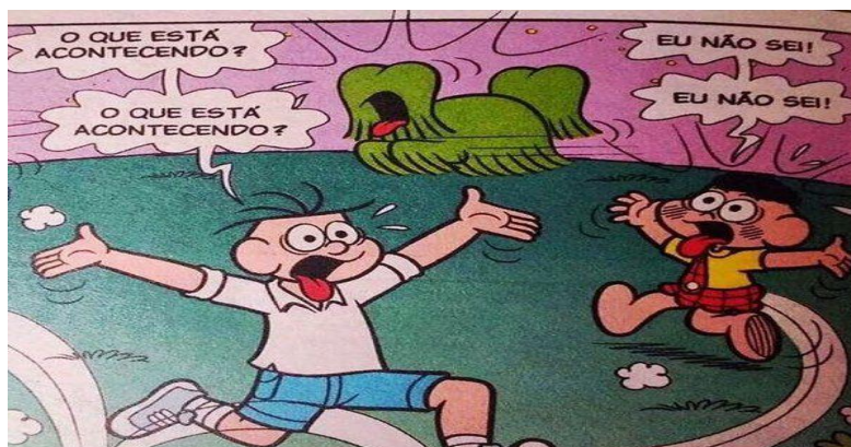
Figura 1.

Durante minha atuação no CREAS, lembro-me como se fosse hoje de uma intervenção que realizamos de forma individual com uma adolescente que nos trouxe informações sobre a violência sexual cometida pelo padrasto desde a infância. Posteriormente realizamos uma intervenção individual com a mãe que estava ainda em processo de negação (durante o acompanhamento, ela nunca saiu dessa fase), de interpretar que a violência foi um mal entendido e de afirmar que eles já haviam conversado e seu marido havia pedido desculpa. Nunca me esqueço que nesse momento minha sensação era de estar correndo lá fora, no quintal do CREAS e gritando “O que tá acontecendo?” Tal qual aquela tirinha do Cascão (figura 1).